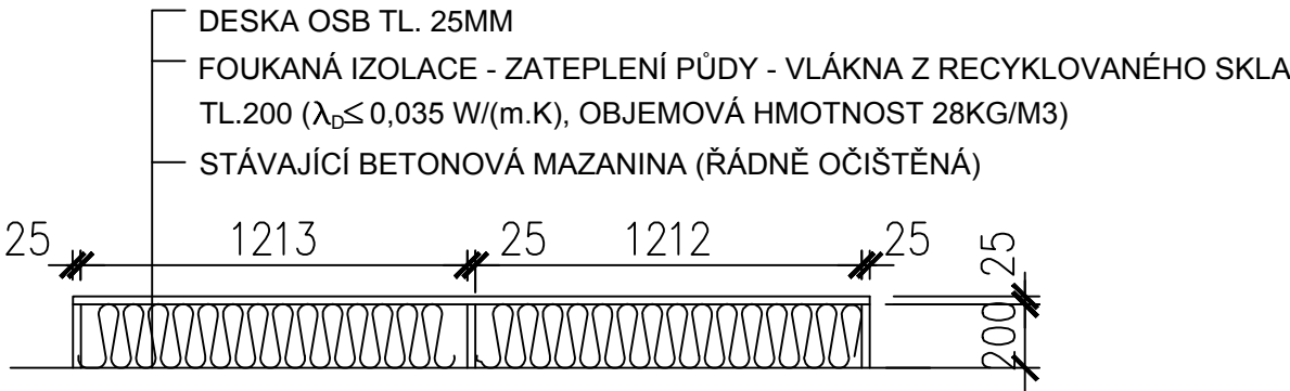
ŘEZ - SCHÉMA NAPOJENÍ